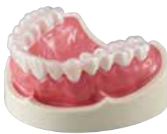
エルコロックプロ クリア

材質: PETG / TPU 一般的名称: 歯科咬合スプリント用材料 医療機器届出番号: 14B1X00011000497