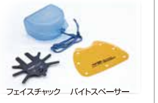
フェイスチャック バイトスパーサー