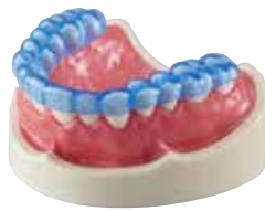
エルコロックプロ ブルー