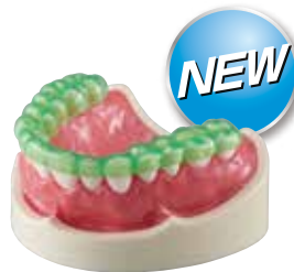
エルコロックプロ グリーン