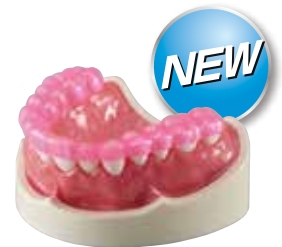
エルコロックプロ ピンク